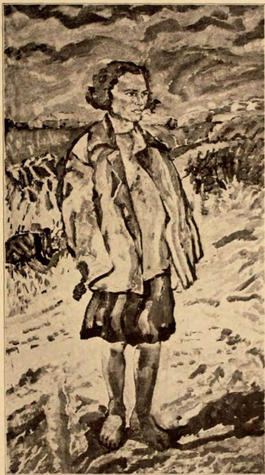
A colonist girl