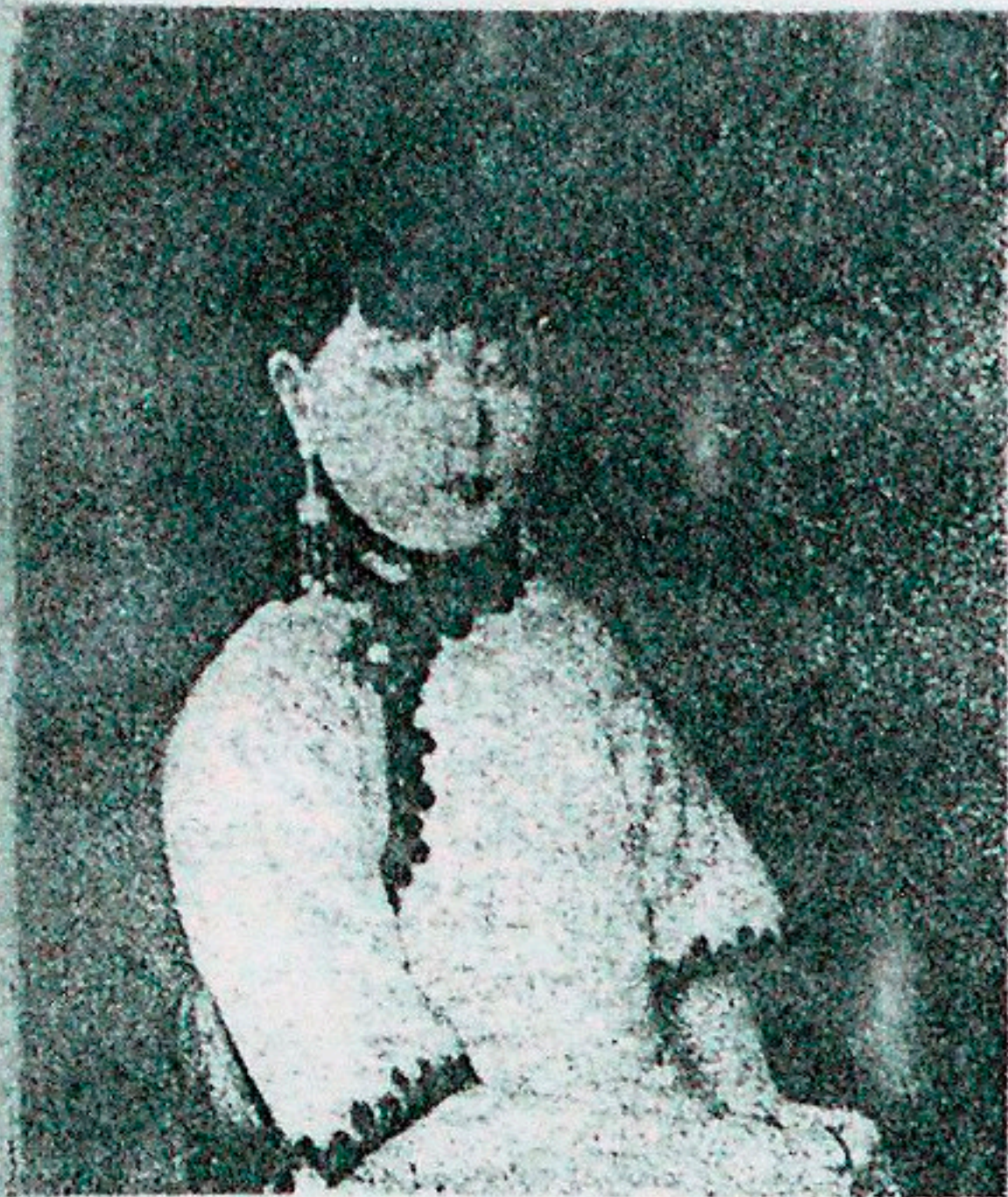
«Маньчжурская красавица». Портрет работы Е. А. Медвѣдовой.

Много талантливых русских людей разсыяно революціей по свѣту. Лишенные родной страны русскіе писатели, художники, скульпторы не погибли, как художественныя величины, не «зарыли своих талан-