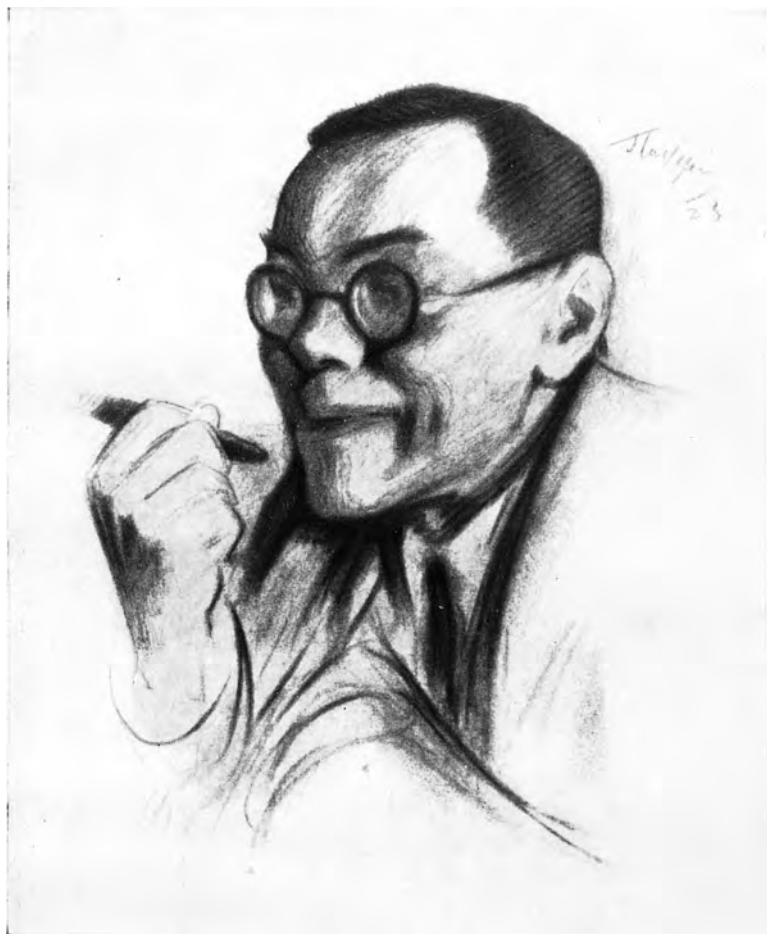
Портрет А. М. Ремизова работы Л. О. Пастернака. 1923 г. Литография.