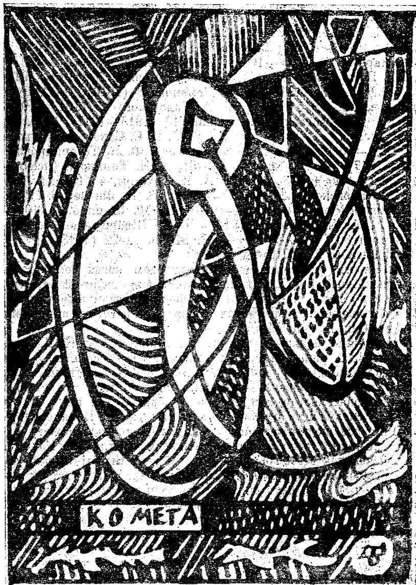
Рисунок А. М. Ремизова «Комета» (для гадальных карт).