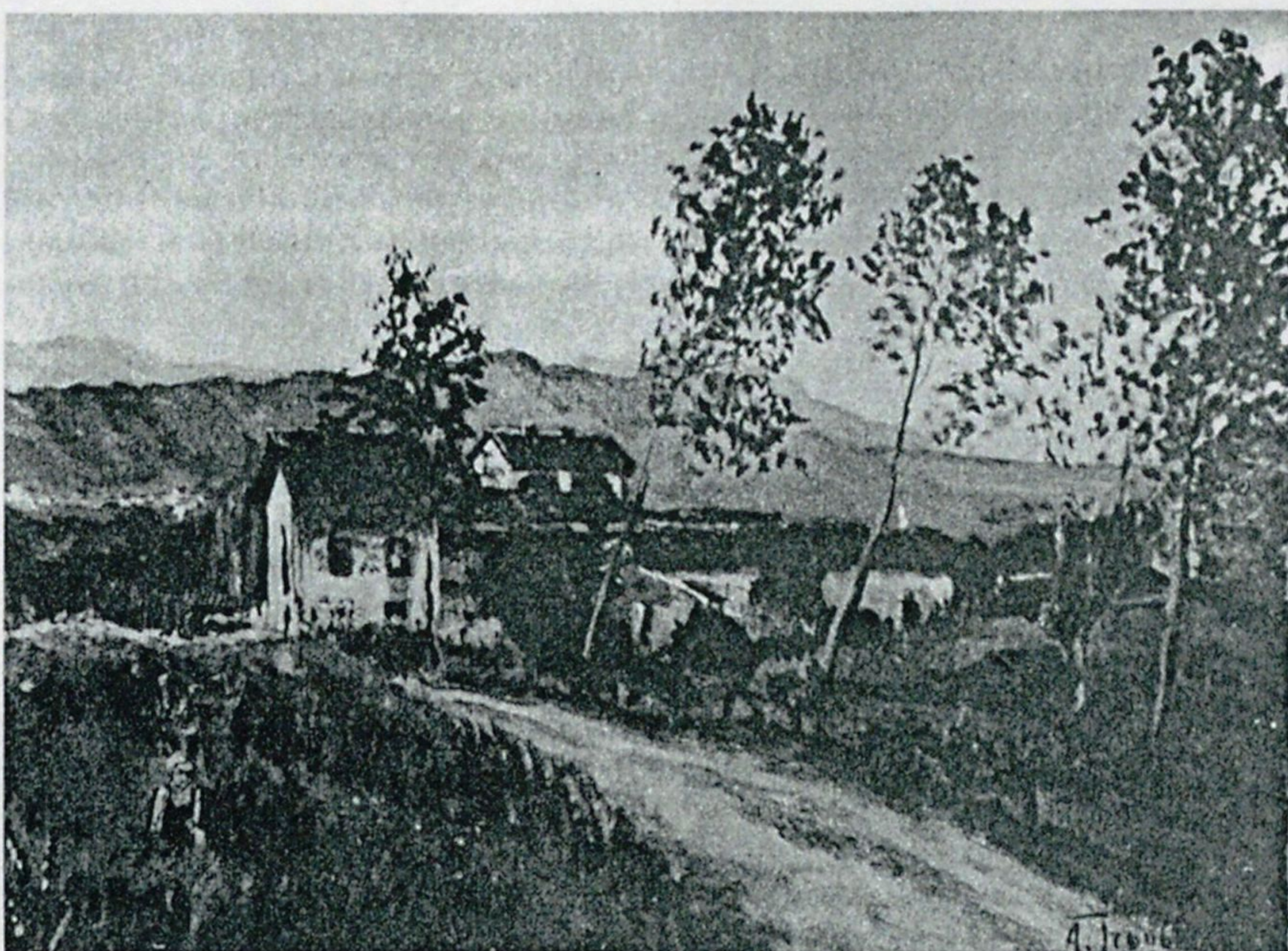
Ферма в Италии