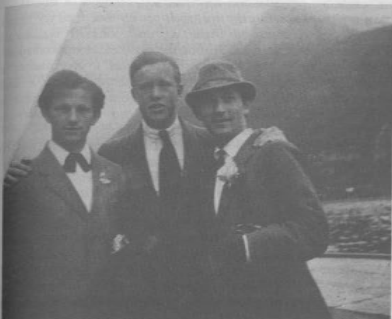
Антуан Певзнер (слева) и Наум Габо (крайний справа)

В соответствии с одним из тезисов "Реалистического манифеста".