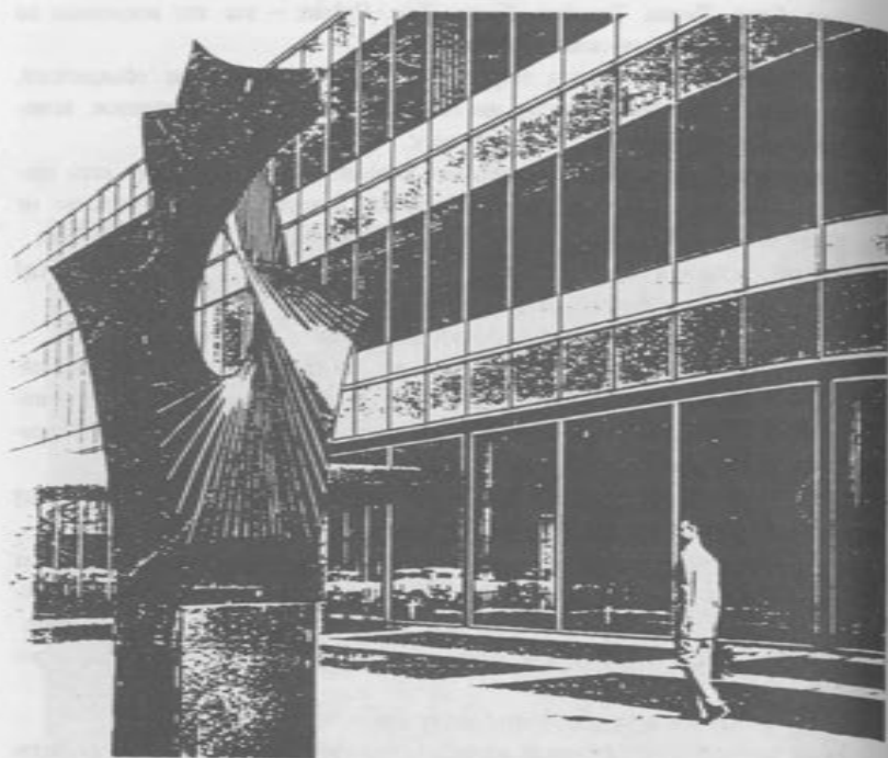
А.Певзнер. Разворачивающийся столп свободы

в созданных в эти годы Габо проекте радиостанции для Серпухова и Кинетической модели. В кровавом хаосе трагической жизни России, в опустошенной Москве конструкция Габо — проект радиобашни — выглядела материализовавшейся поэтической мечтой-образом организованного и разумного голоса. В этом проекте Габо целеустремленно сводит массу к минимуму, основывая конструкцию на выступающих в пространство плоских пластинах, улавливающих рассеянный в нем звук и направляющих его по определенному руслу. Открытая форма, обладающая тенденцией к полному растворению, рассеиванию в пространстве, тяготеет к слиянию с кругом, стремится целиком отдаться в его власть.