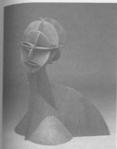
Наум Габо (1890-1977) и Антуан Певзнер (1886-1962) – скульпторы- конструктивисты*