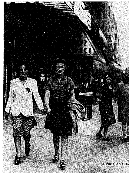
Париж. 1942 г.