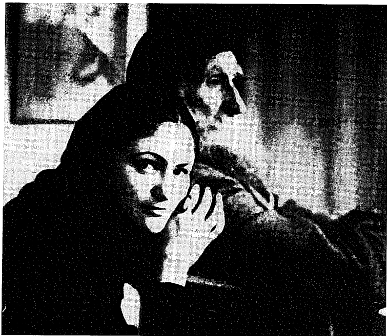
Майоль и Дина. 1943 г.