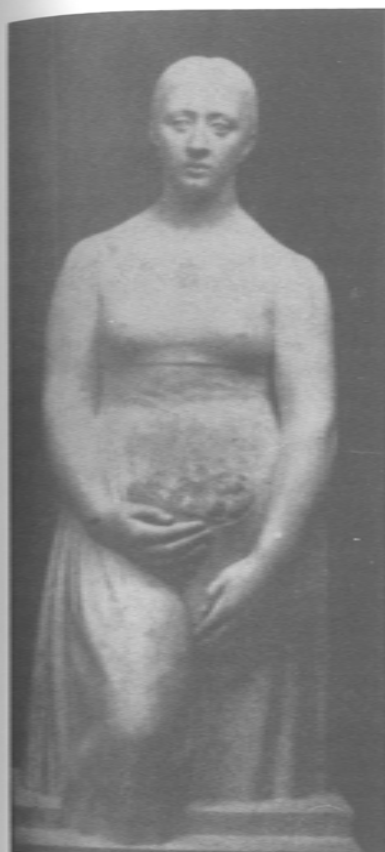
Оскар Мещанинов. Девушка с букетом. Начало 1920-х годов. Гипс

Пройдут годы. Всякие "измы" станут достоянием хладнокровной истории. Имя Альтмана не будет связано ни с одним из этих "измов". Альтман есть и останется личностью, личностью, коя рамки свои и глубину свою раздвинула, воспользовавшись нужным ей, которая обострила и осовременила свое вечное. Альтман [...] съел кубизм, запил его реализмом и закусил [...] ремеслом. Это пошло ему только на пользу. Альтман молод – он весь еще в будущем; но, если б он был седым и немощным старцем, сделанного им достаточно, чтобы в истории русского искусства занимать одно из виднейших мест; в истории же еврейского искусства современности Натану Альтману уготована первая страница.