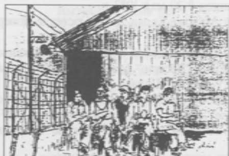
Владимир Саган. Пяттеро интернированных (1941).