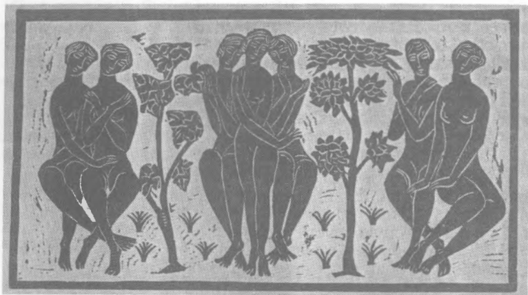
Моисей Коган. Группы девушек среди деревьев. Гравюра на дереве

сея Когана. После этой выставки он сразу приобрел известность.