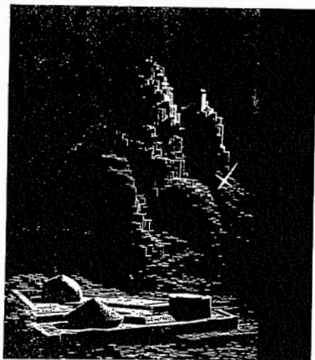
Проект Центра трех религий