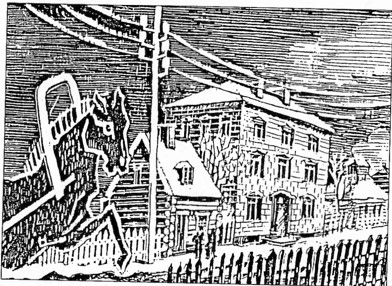
Добрая Слободка. Москва. 1919 г.