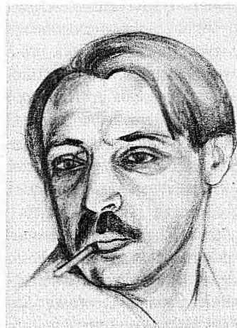
Савелий Сорин. Автопортрет. Около 1920 г. Публикуется впервые