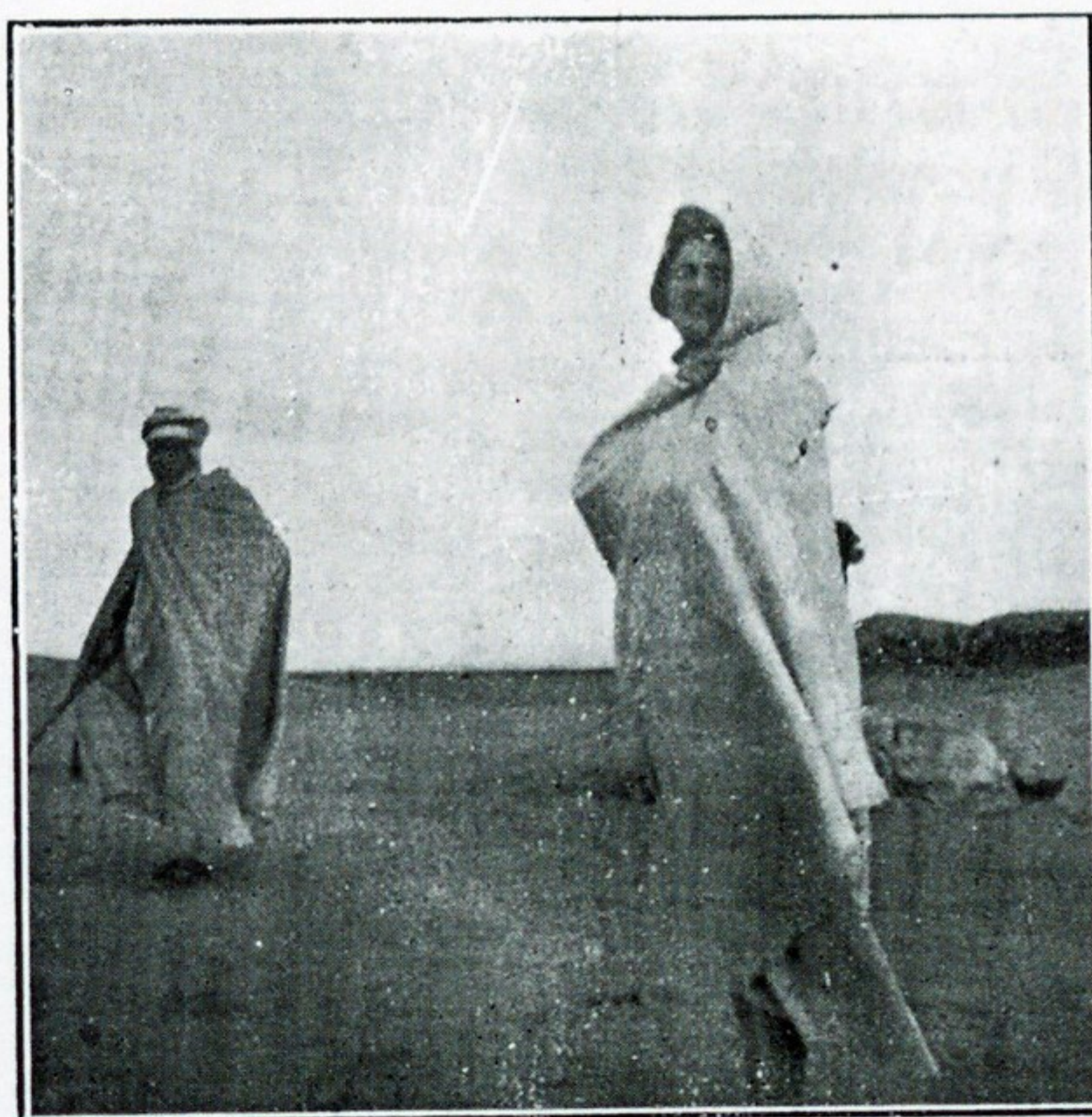
Фотографія художницы въ пустынь Сахаръ