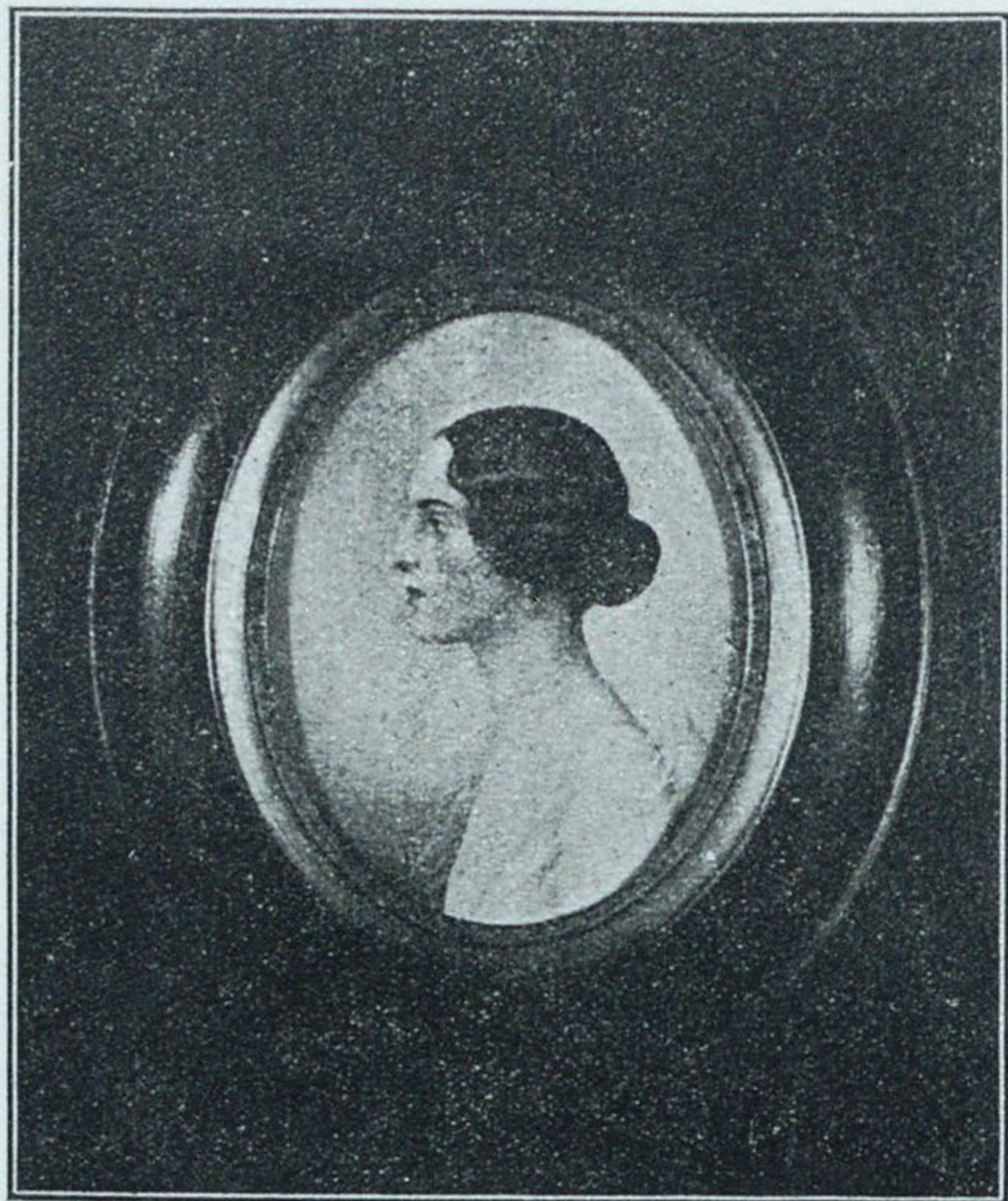
Княгиня И. А. Юсупова

Представленный въ весеннемъ Салонѣ 1930 года прелестной нѣжной миниатюрой madame Lelong, баронъ Феофилъ Феофиловичъ Мейендорфъ широко извѣстенъ въ кругахъ русскихъ и иностранныхъ цѣнителей искусства.