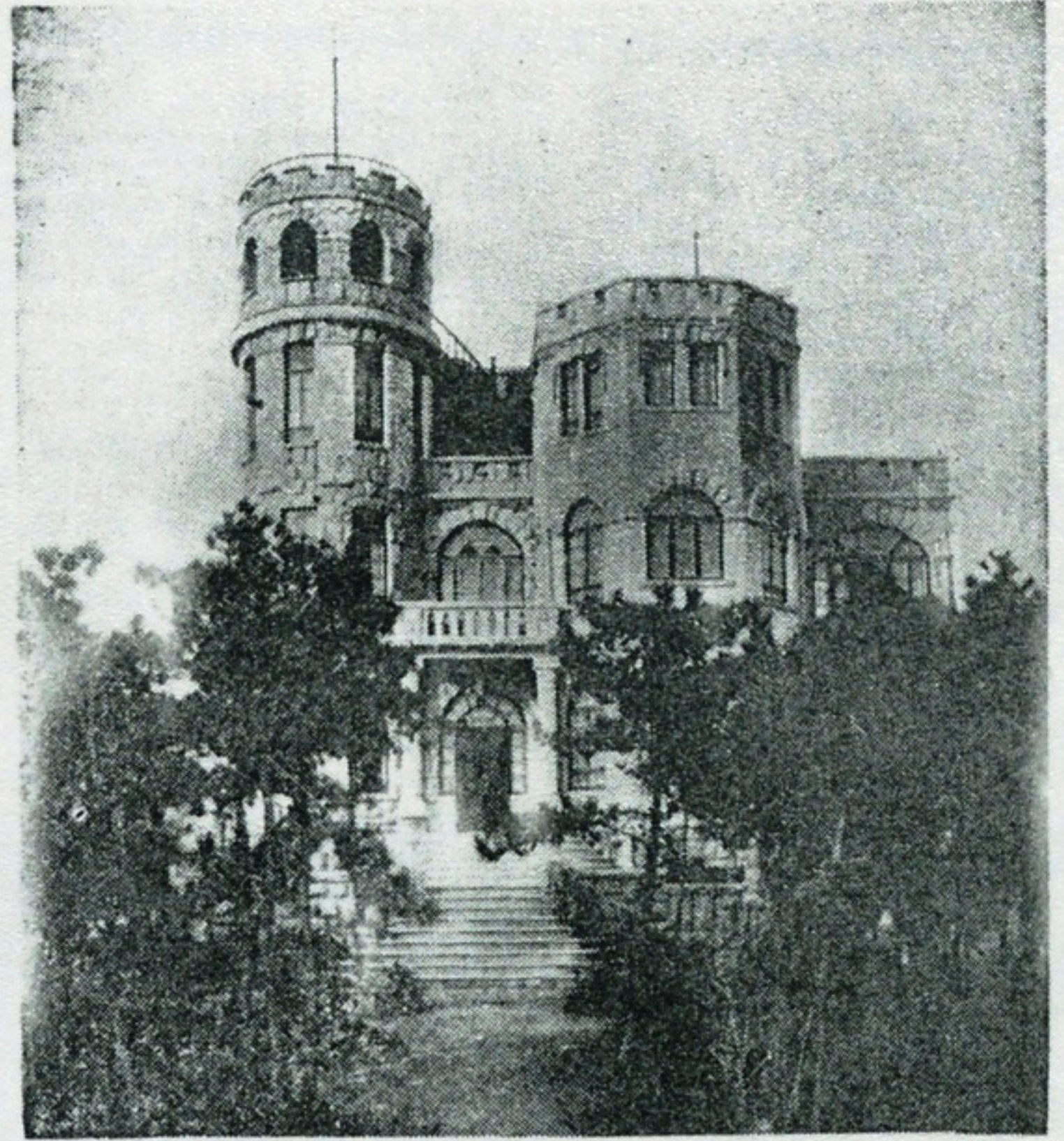
Дача издательства «Заря» в Циндао.