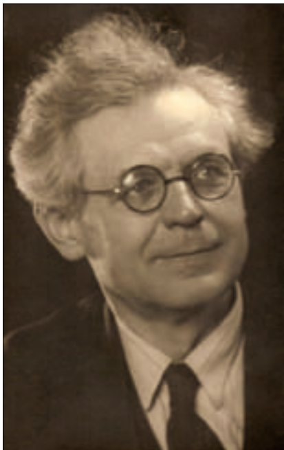
И. П. Антонов.