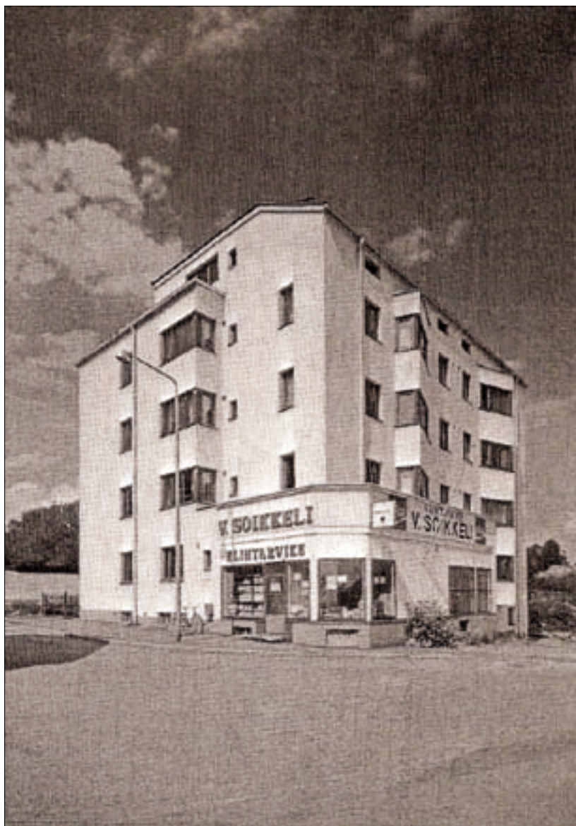
Жилой дом в Юванскула. Финляндия. 1945. Архитектурное бюро Я. Ланкинена