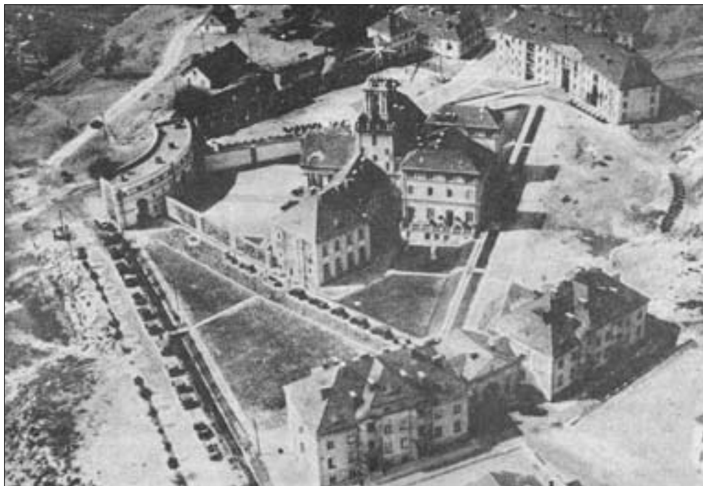
М. Ляевич. Комплекс зданий командования флота и казарм военно-морского флота. Общий вид. г. Гдыня, Оксиви. 1924–1930