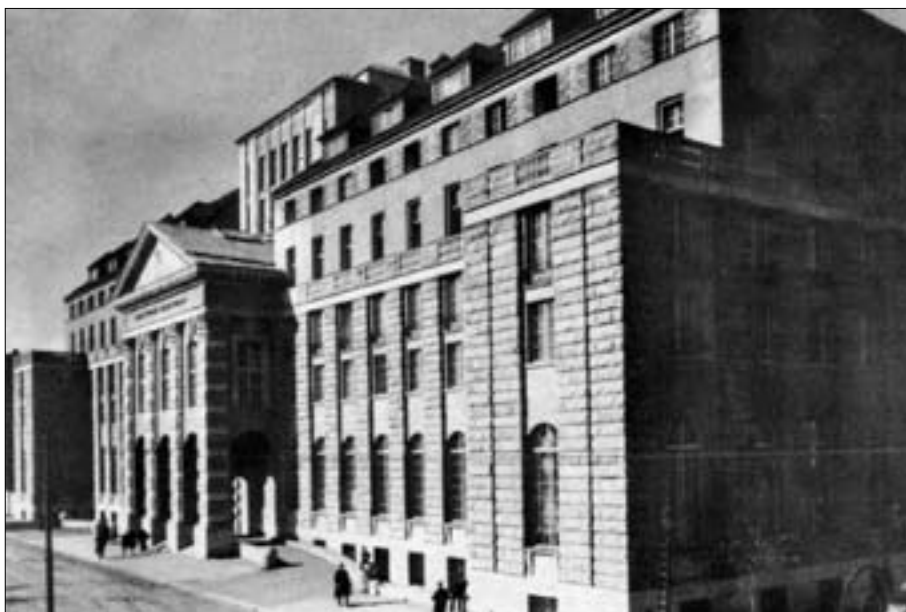
М. Ляевич. Здание государственного сельскохозяйственного банка. г. Варшава. 1926