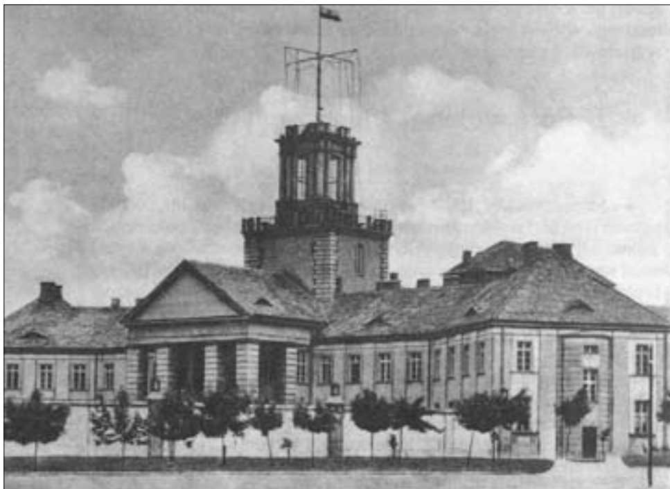
М. Ляевич. Комплекс зданий командования флота и казарм военно-морского флота. Главный фасад (1924–1926). г. Гдыня, Оксиви. 1924–1930