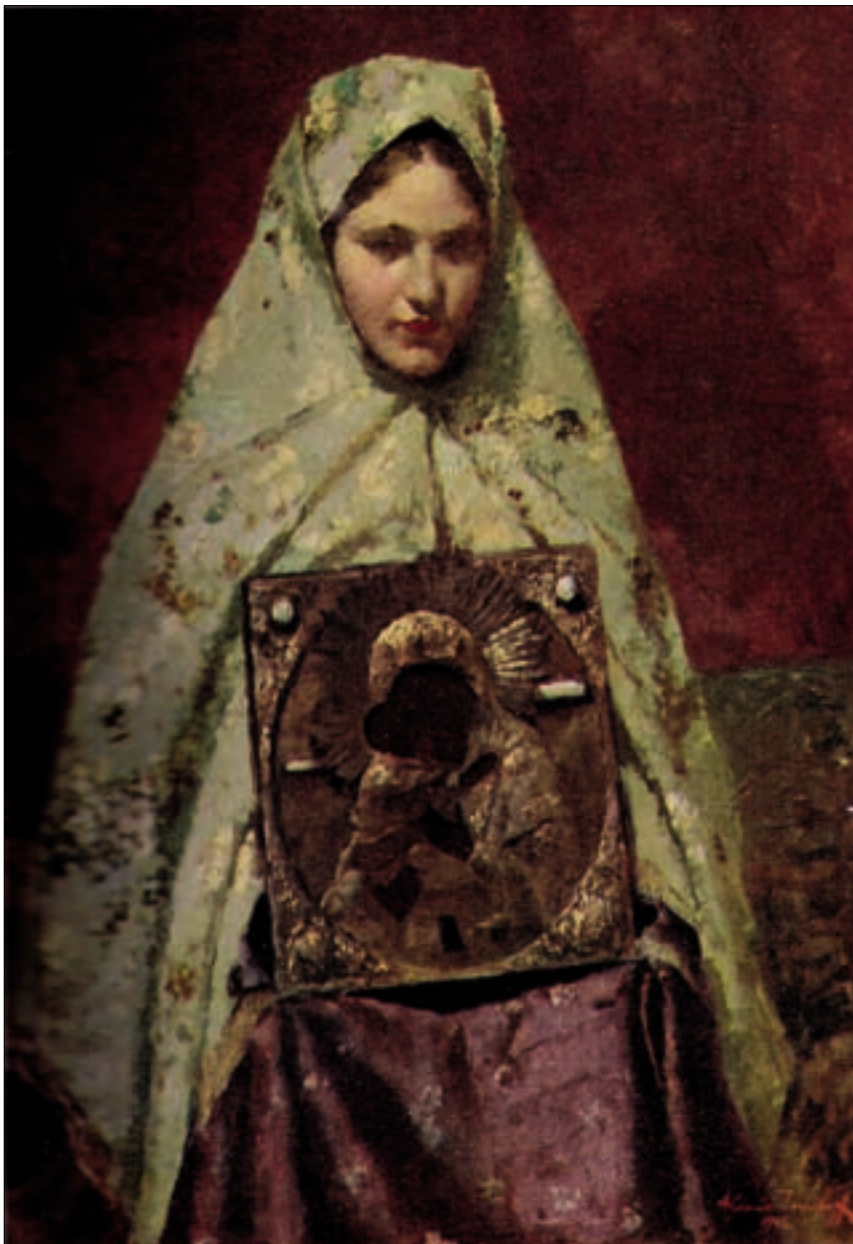
А. В. Исупов. Девушка с иконой. 1945