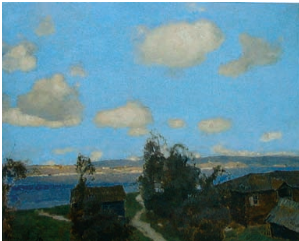
А. В. Исупов. Деревня. Лето