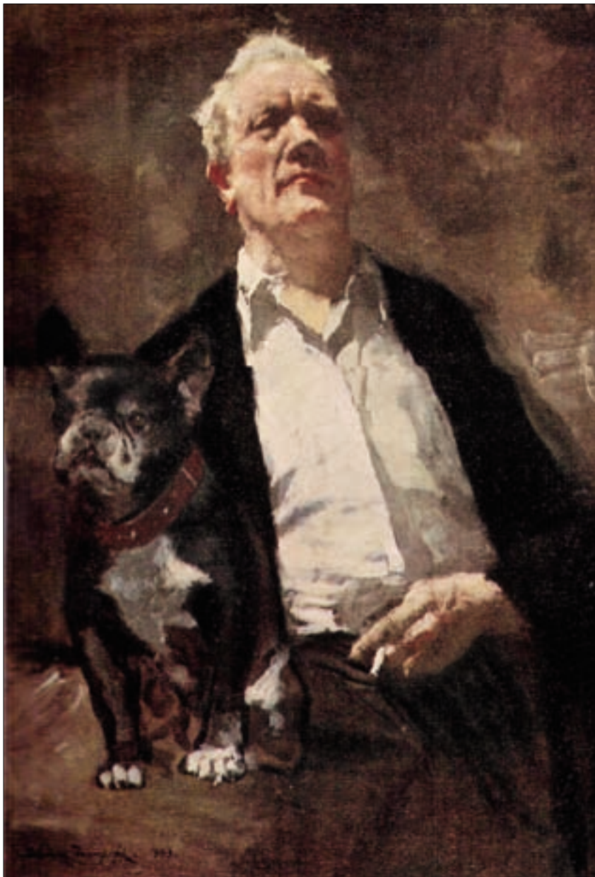
А. В. Исупов. Автопортрет с собакой Ватрушкой. 1943