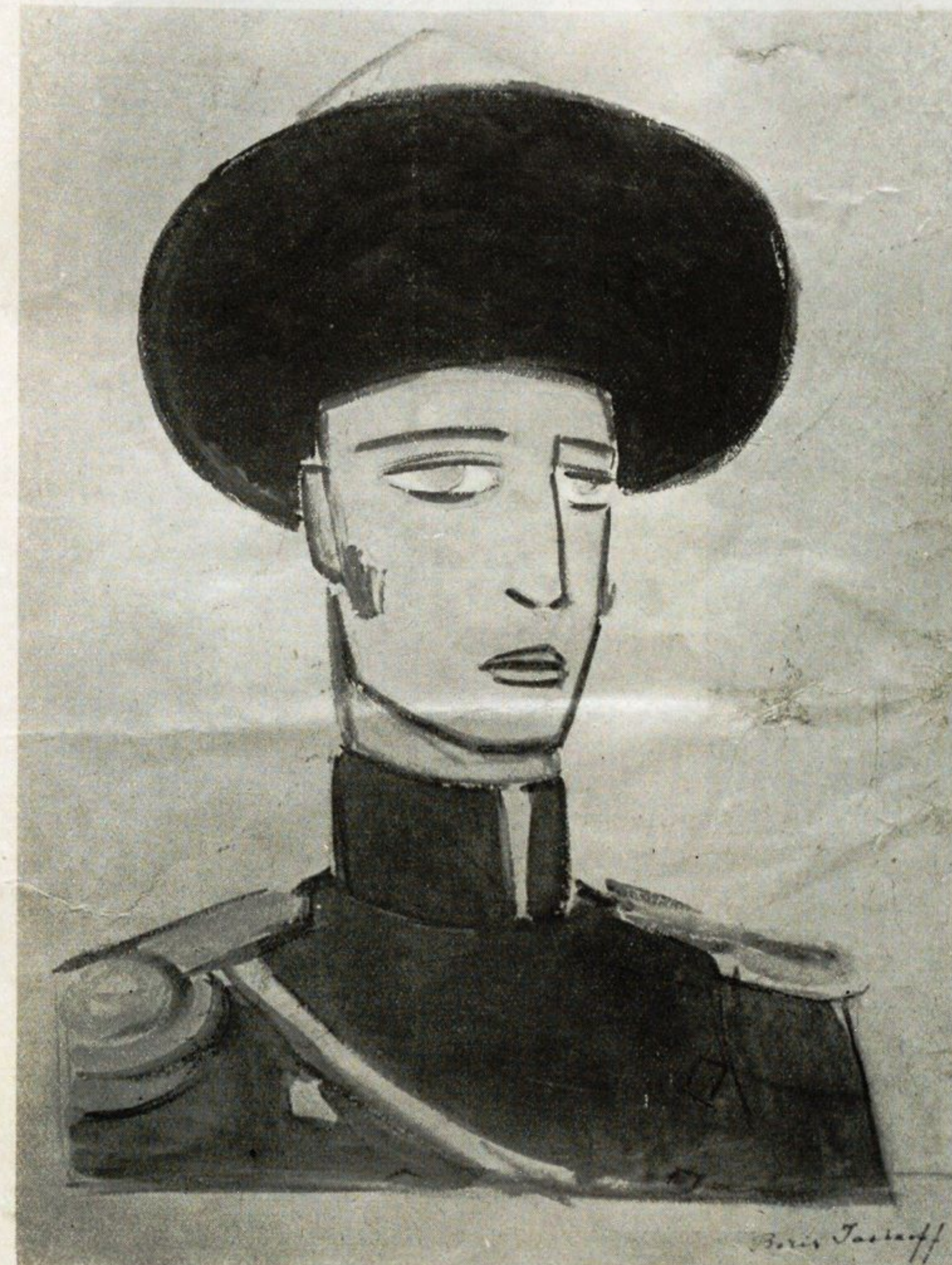
Справа: Голова перса.