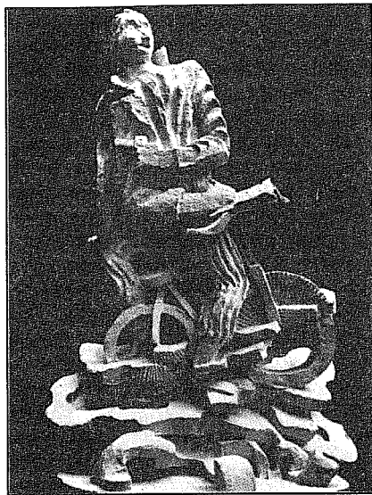
Проект памятника Альфреду Шарри. 1938. Гипс

ки – однако все старания воспроизвести бюст Вольтера работы Гудона окончились плачевно, навсегда отбив охоту к копированию. Зато юный россиянин, применив полученные в витебском училище навыки, охотно занимался резьбой и высеканием с помощью инструментов, подаренных дядей. Переезд в Лондон в 1906 году, знакомство с сокровищами Британского Национального музея окончательно определили стремление Цадкина к художественной карьере.