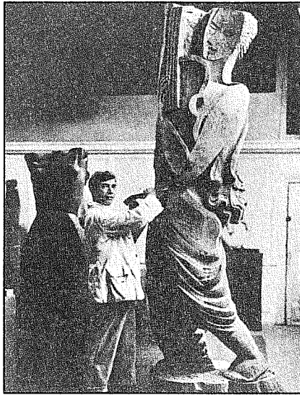
Осип Цадкин в "La Ruche"

Осип Цадкин постоянно жил в Париже, однако подлинная слава и успех пришли к нему из северных краев. В 1920 году в Бельгии состоялась его первая персональная выставка в брюссельской галерее "Кентавр". После успешных выставок в Бельгии, Голландии и Нью-Йорке в 1921 году появилась пер-