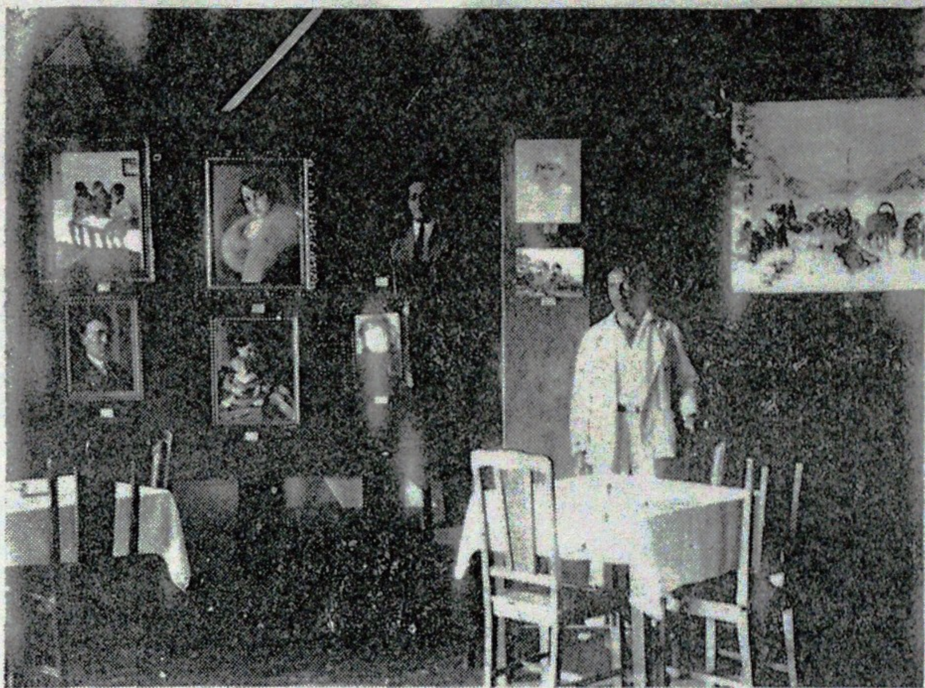
Уголок выставки картин худ. П. И. Сафонова в Циндао.

Когда началась гражданская война, П. И. Сафонов не уклонился от выполнения своего патриотического долга и