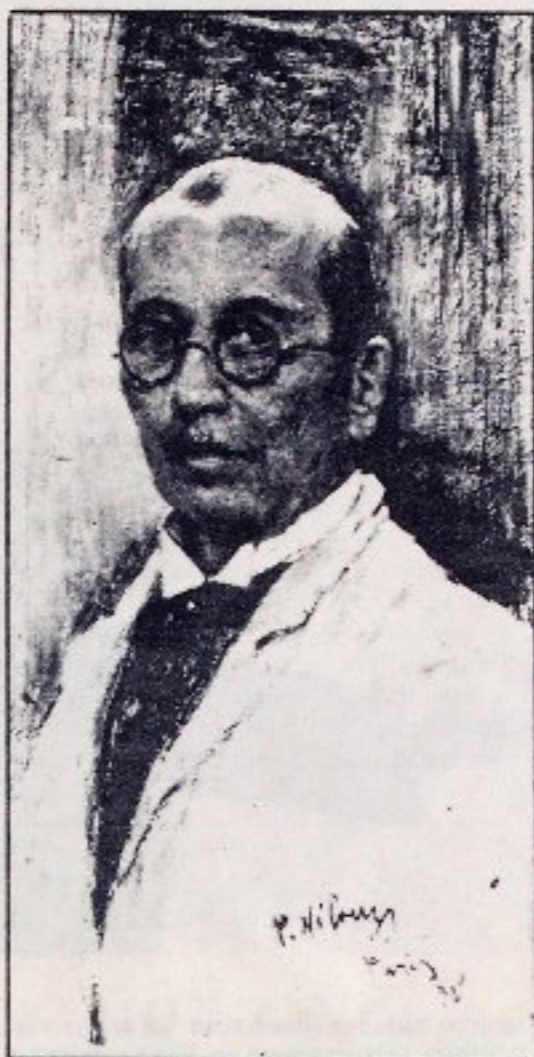
«Автопортрет». 1935. Масло.

К середине 20-х годов у Нилуса пробуждается интерес к характерам и быту ушедшей эпохи. Сам художник так объяснял эту метаморфозу, неожиданную для многих, но столь органичную и живую для него самого. «Вы знаете, что я пережил глубокую ломку, — писал он. — Я был страстным реалистом, писавшим картины с лю-