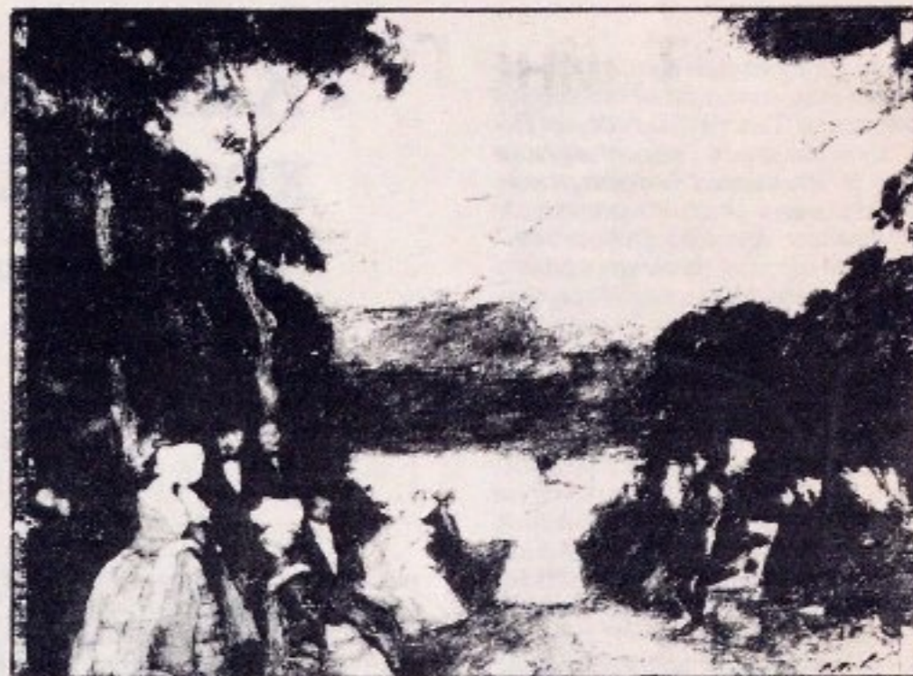
«Концерт». 1921-1923. Акварель.