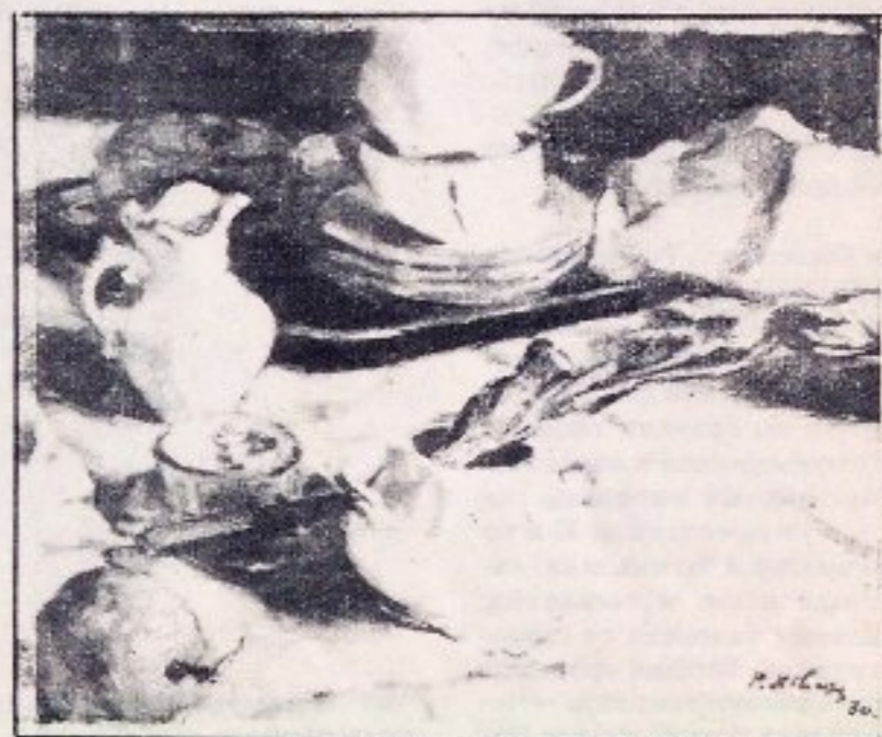
«Белый сервиз». 1930. Масло.