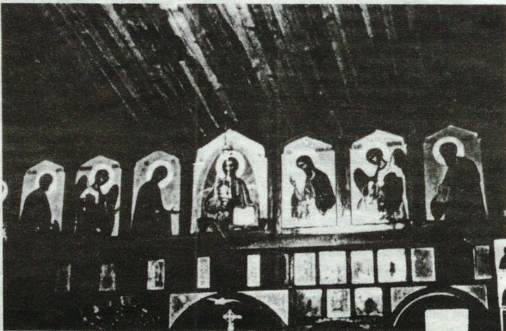
Церковь Успения Божией Матери в Фатиме. Иконостас работы Г.В.Морозова.

ение, в котором он всегда находился. Богом дарованный ему талант сочетался в нем с откровенной добротой и открытостью к людям. Одной из главных черт его харак-