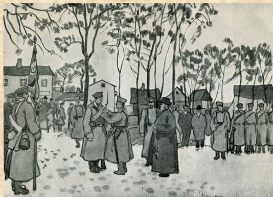
Парад в Кельцах. Награждение Георгиевскими крестами. Репродукция в журнале «Лукоморье» № 22, 1914. С. 11.