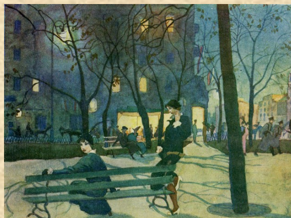
В Варшаве. Репродукция в журнале «Лукоморье» № 24, 1914. С. 13.