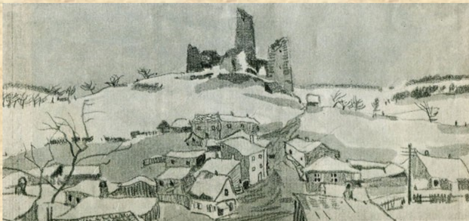
Местечко Хенцины Келецкой губернии. Репродукция в журнале «Лукоморье» № 22, 1914. С. 10.

В 1915 году германское командование поменяло стратегию, решив перенести главный удар с Западного фронта на Восточный, чтобы добиться поражения России и принудить её к сепаратному миру. Под конец 1914 г. в русских войсках стала ощущаться нехватка снарядов, так что 1915-й стал годом Великого отступления русских армий и потери Польши. В Царстве Польском были оставлены Радомская и Келецкая губернии, фронт прошел через Люблин, только что взятый Перемышль был оставлен 16 июня, Львов – 22 июня. 4 августа русские войска оставили Варшаву, 26 августа – Брест-Литовск, 18 августа – Гродно.