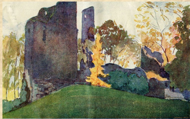
Развалины Хенцинского замка Келецкой губернии. Репродукция в журнале «Лукоморье» № 26, 1914. С. 13.