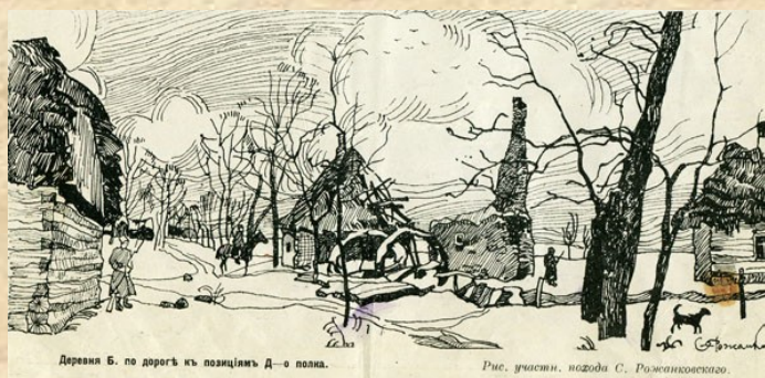
Деревня Б. по дороге к позициям Д-о полка.

По названиям изображенных городов видно, что Рожанковский воевал в составе одной из пяти армий Юго-Западного фронта (под командованием генерала Иванова), наступавшей в Галиции. Обстановка на южной части границы с Австрией вначале складывалась не слишком успешно для русской армии. К 1–2 сентября (н.ст.) русские войска отступили на территорию Царства Польского, к Люблину и Хелму. Зато в центральной части фронта наступление русских войск оказалось результативным, и 25 августа (3 сентября) они заняли Львов. После этого русская армия сохранила высокий темп наступления и в кратчайший срок захватила огромную, стратегически важную территорию – Восточную Галицию и часть Буковины. К 13 (26) сентября фронт стабилизировался на расстоянии 120–150 км западнее Львова. Сильная австрийская крепость Перемышль оказалась в осаде в тылу у русской армии. Зато действия германских войск были гораздо успешнее. 28 сентября (н.ст.) они начали наступление в северо-восточном направлении и к 12 октября дошли до Варшавы. В результате ожесточенных боев постепенно определилось преимущество русской армии, которая 20 октября перешла Вислу. Таким образом к 26 октября германские войска, не добившись успеха отошли на первоначальные позиции.