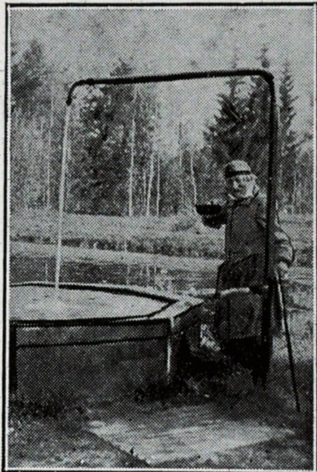
И. Е. Рѣпинъ въ «Пенатахъ»

Быстро пролетѣли эти дни праздниковъ съ Тронькой. Мы никуда не выходили и ничего не видѣли, кромѣ нашихъ раскрашенныхъ картинокъ,