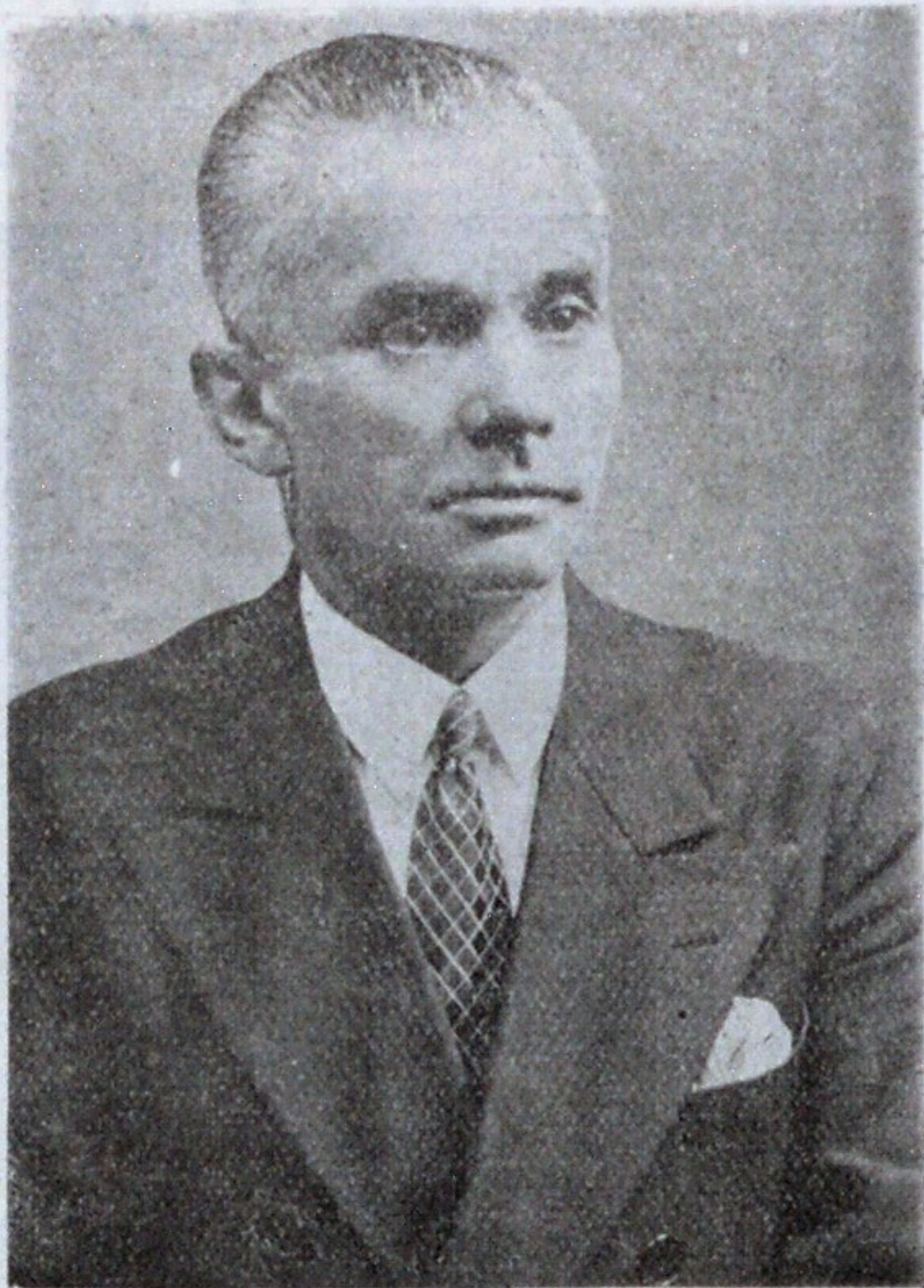
Ген. - майоръ М. П. Мындра - Курбскій