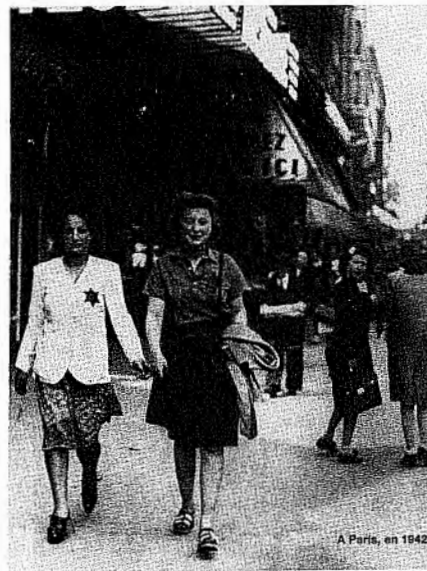
Париж. 1942 г.