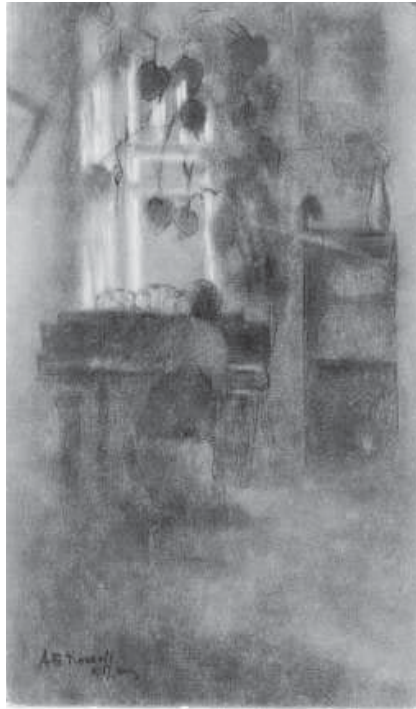
А.Б. Козлов. Імпровізація. 1911 р.