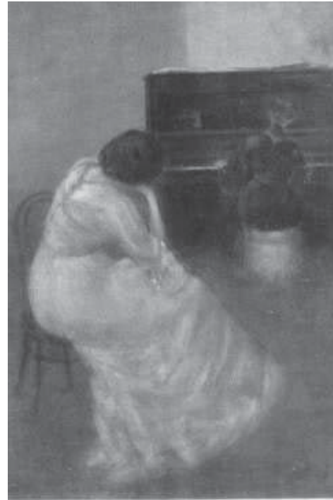
А.Б. Козлов. Музика. 1911 р.