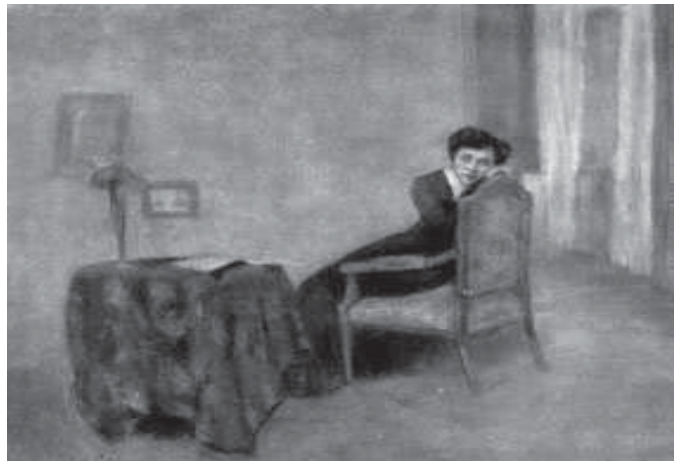
А.Б. Козлов. Сутінки (мотив з «Днів нашого життя») 1911 р.