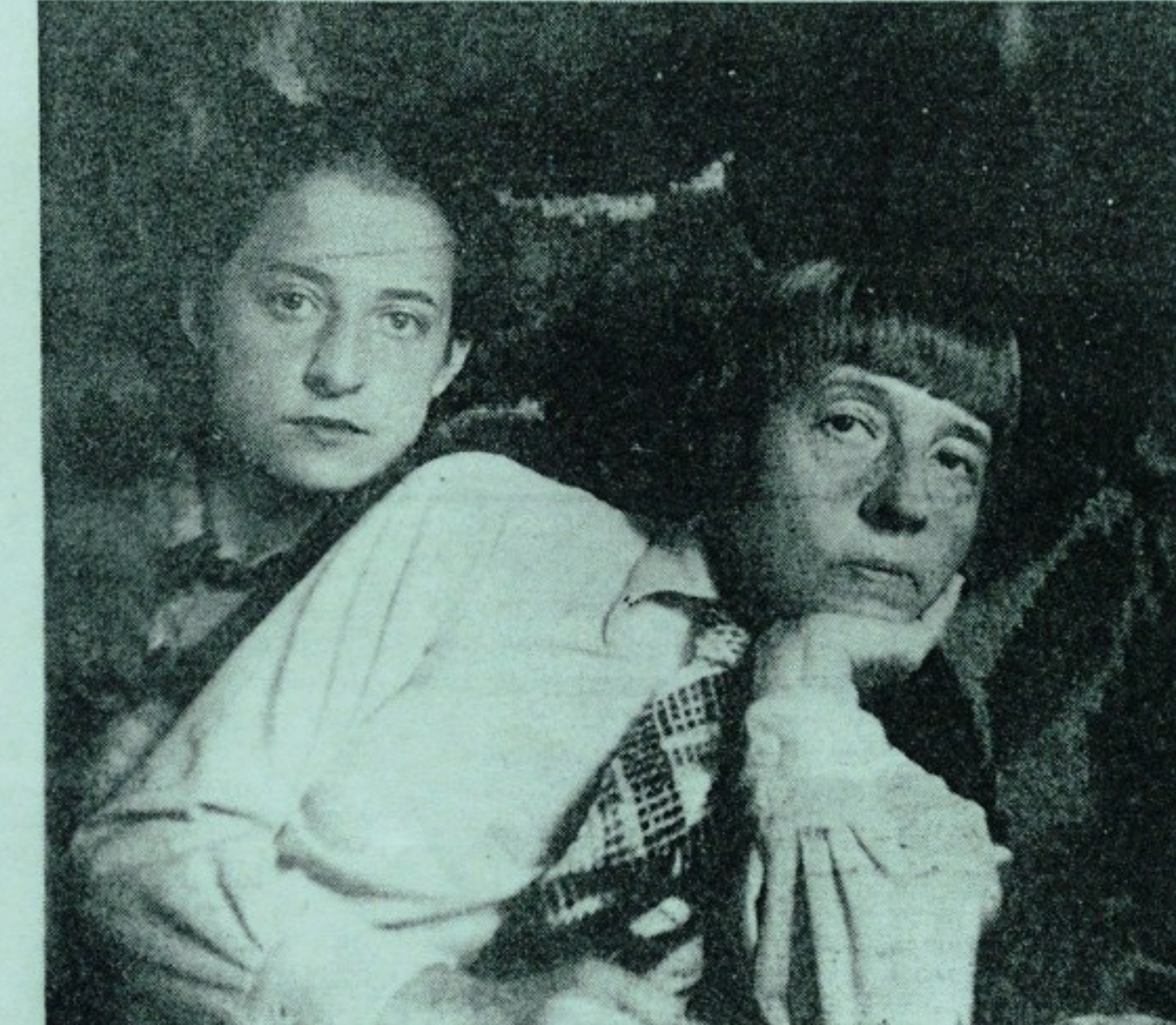
Фалилѣвы, — мат. художница и дочь-скульпторша.

Голубев-Багрянородный — художественная натура.