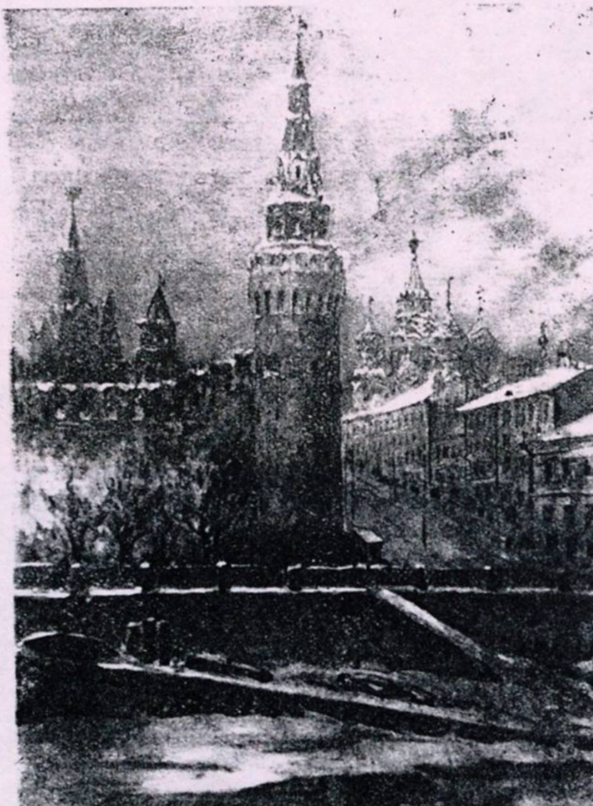
В. Фалилеев. — «Москва. Кремль».

Глава семьи, Владимир Дмитриевич, оригинальный пѣвец волежских заговоров, по своему направлению весьма близок Левитану и Архипову. Но не только типично-русскіе, с налетом лирики, ландшафты увлекают художника, — его влечет к себѣ оригинальное сочетаніе кра-