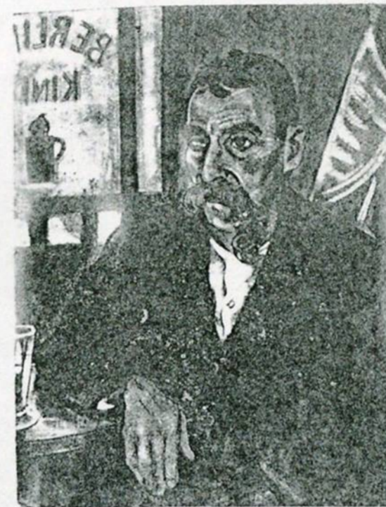
Александр Арнштам — «В день полочки». Тип берлинскаго рабочего.

Эта семья и-стоящих художников сумѣла и в тяжелых эмигрантских условіях обставить свою жизнь так, что «по-