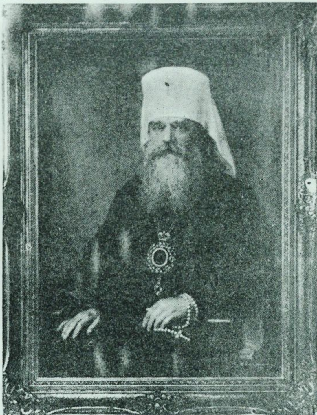
Митрополит Сергий Японский.

сток давно уже знает и высоко ценит художника-иконописца Николая Степановича Задорожного, украсившего своими полотнами несколько харбинских церквей. В свое время «Рубеж» знакомил чи-