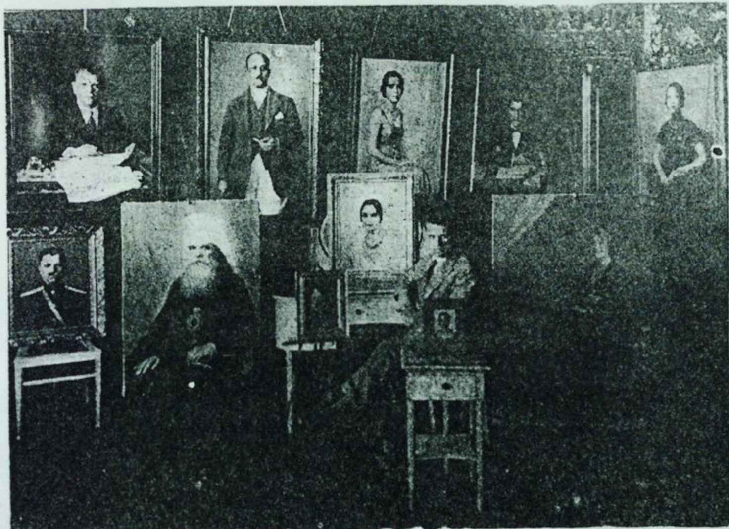
Выставка портретов художника Н. С. Задорожного в Шанхае.

Портреты кисти Н. С. Задорожного — подлинные двойники натуры. В них с большим художественным чутьем подмечены и зафиксированы все индивидуальные особенности человека. В каждом своем портрете художник дает