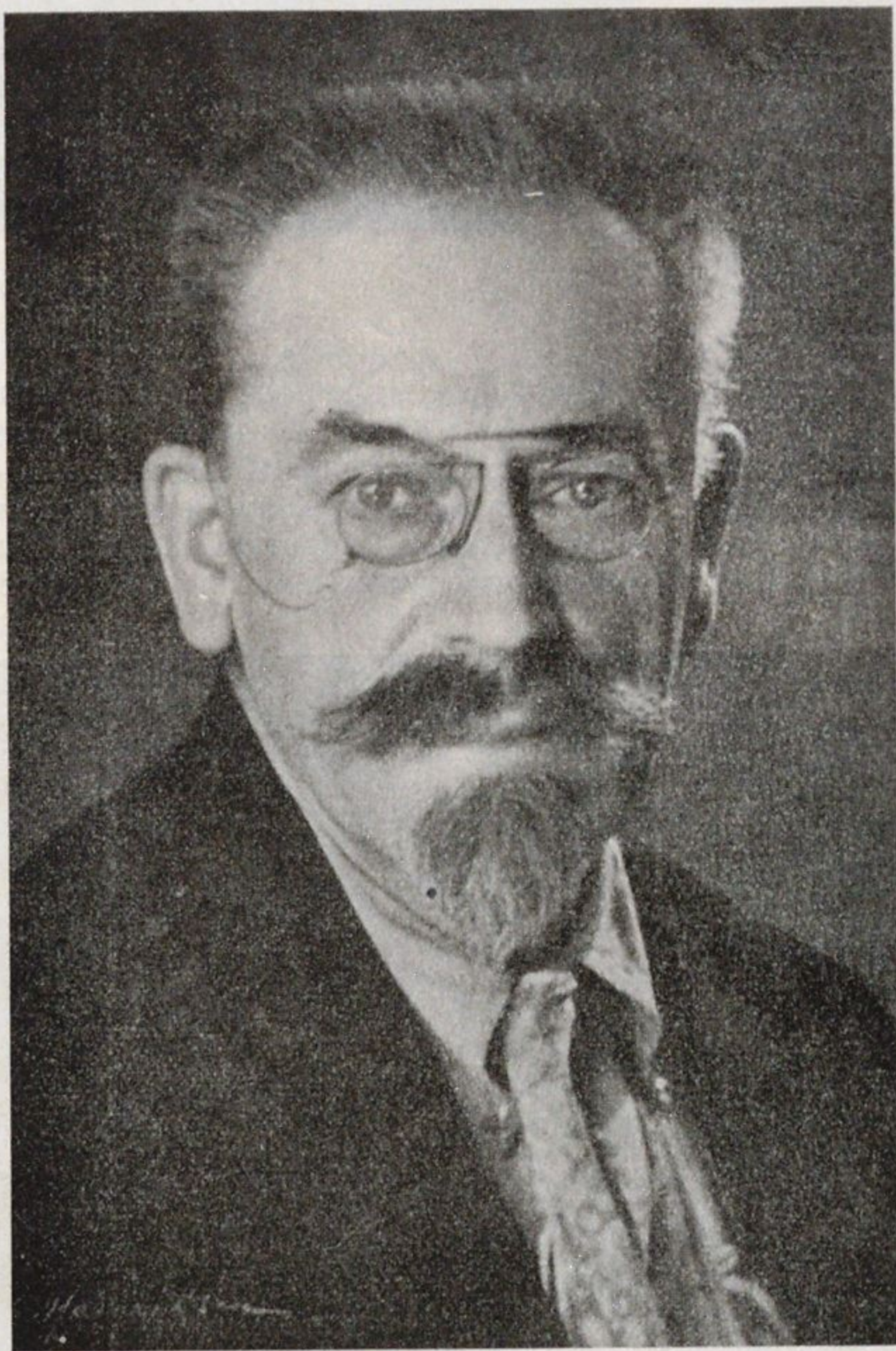
Б. В. БЕЗСОНОВЪ

26 ноября с.г., въ мѣстечкѣ Мозаршъ, близъ Парижа, внезапно скончался одинъ изъ старѣйшихъ русскихъ художниковъ Борисъ Васильевичъ Безсоновъ. Еще одной дорогой могилой на чужбинѣ стало больше. Еще одного прекрасной души человѣка, глубокаго патріота и хорошаго художника, мы потеряли.