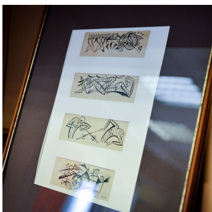
Рисунки Ю.Анненкова к книге Н.Евреинова «Театр для себя»