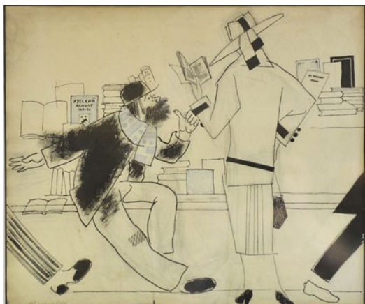
Ю.Анненков. «В книжной лавке». 1922. Рисунок. Бум., тушь, цв. кар.

В заключение хотелось бы выразить надежду, что этот год станет переломным в изучении творчества замечательного художника русского авангарда Юрия Анненкова, и составление полного каталога его произведений уже не за горами.