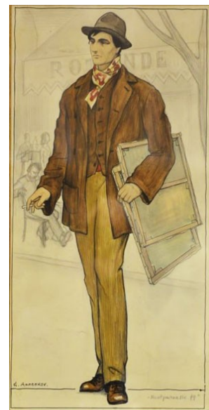
Ю.Анненков. Модильяни. Эскиз костюма. 1956 г.