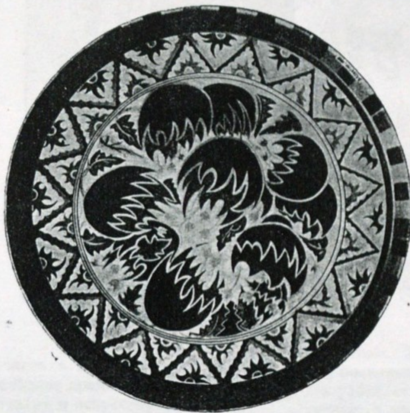
С. М. Лисимъ. Блюдо. (Музей Декоративныхъ Искусствъ въ Парижѣ).

Итальянская комедія, Национальный Рижскій Драматическій театръ, гдѣ онъ пишетъ къ роستانовскому “Орленку” декорации. Эта послѣдняя постановка — триумфъ художника. На столбцахъ газеты “Слово” Н.