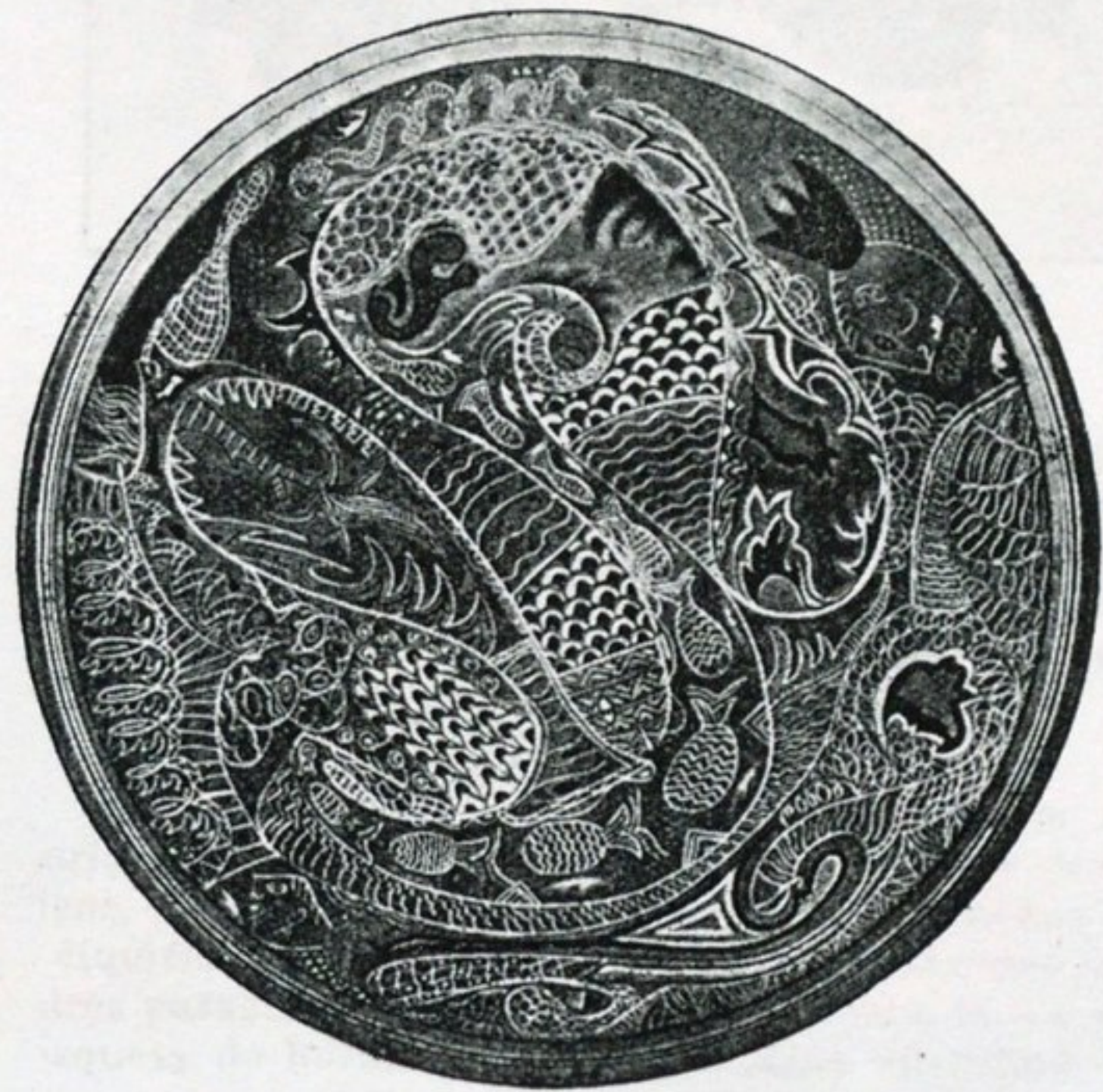
М. Лисимъ. Блюдо (Севрскія Государственный фарфоровый музей).

Вторую половину года С. Лисимъ посвящаетъ