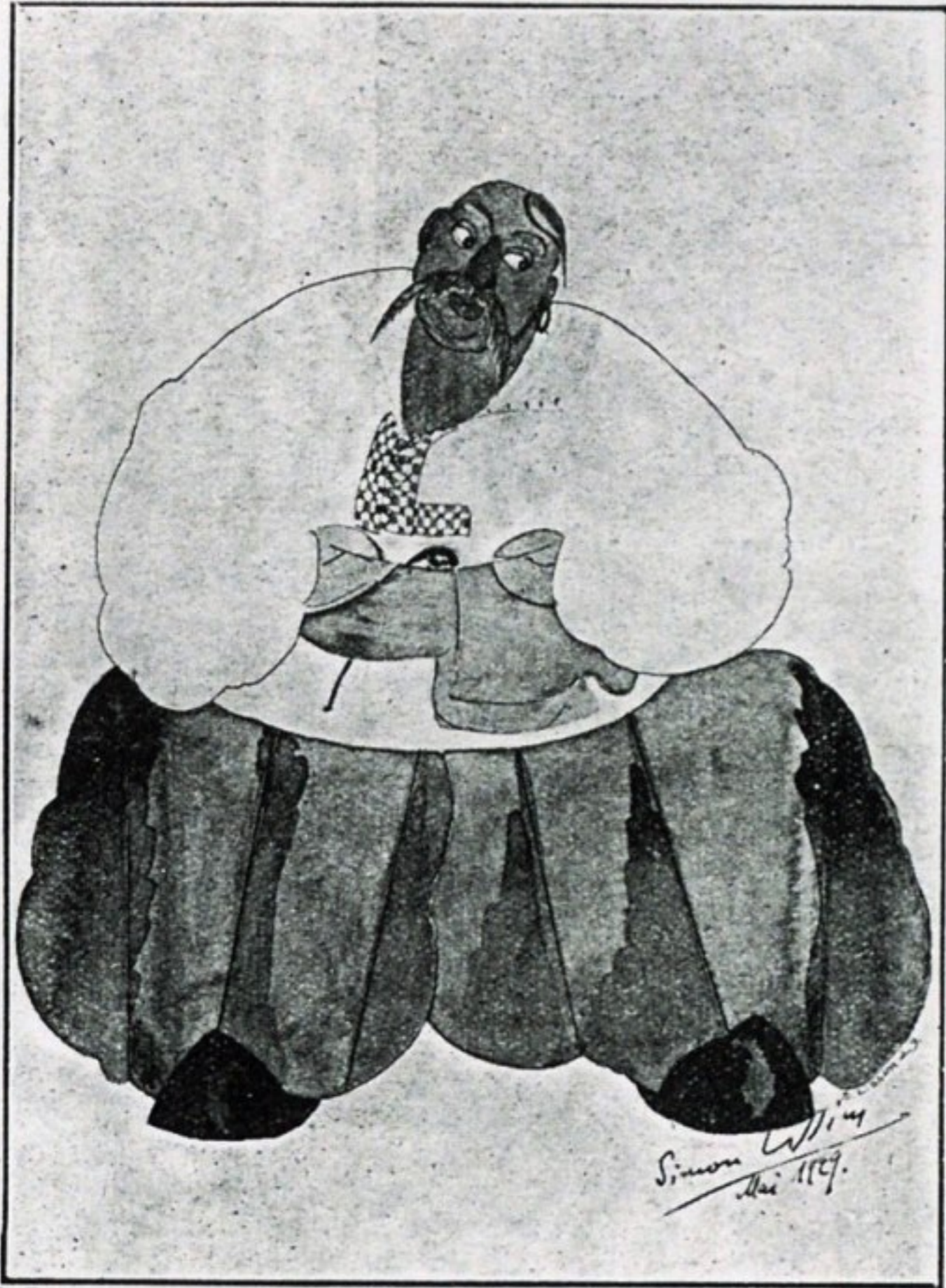
С. М. Лисимъ. Казакъ (для балета).

О работахъ Лисима выпущена книга французскаго