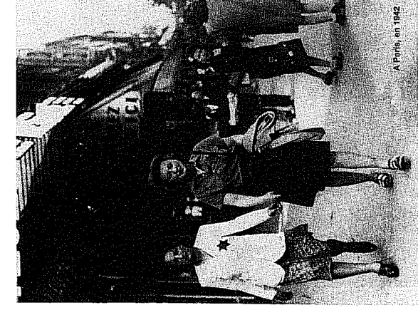
Париж. 1942 г.