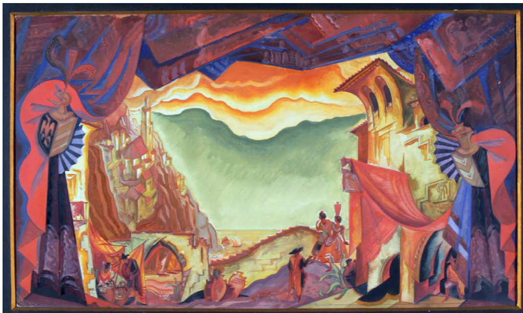
Ю. Рыковский. Эскиз декорации к опере "Дон Кихот«.