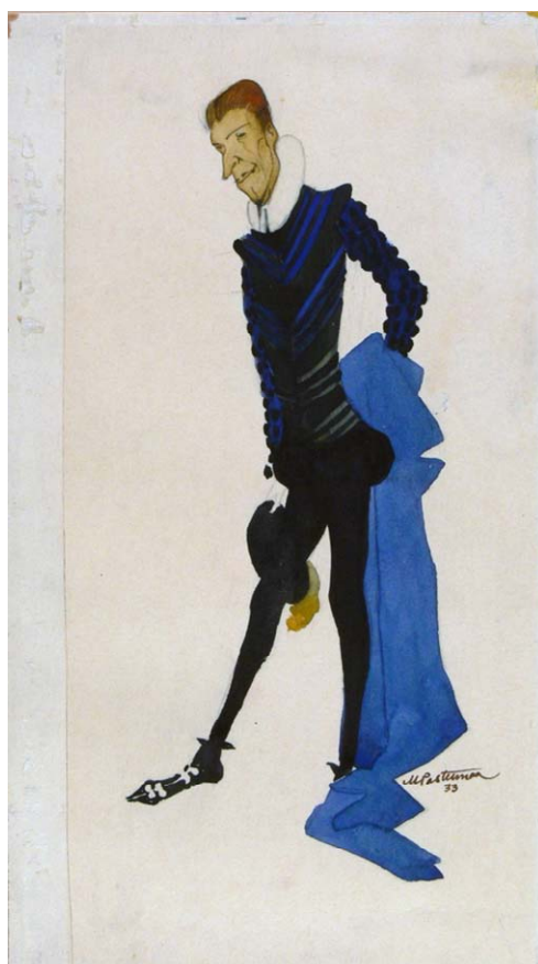
М. Пастернак. Эскиз костюма к опере "Гугеноты"